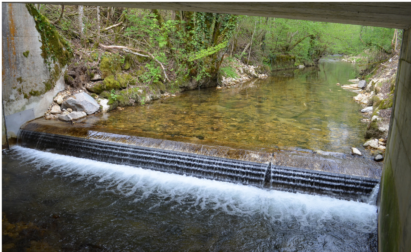
Barriere di protezione nel fiume Lützel (Basilea Campagna): i pilastri permettono il reinserimento laterale dei gamberi impedendo che la barriera venga aggirata via terra.

ruscelli. Siccome un abbassamento delle acque provoca una diminuzione del flusso e questo diminuisce drasticamente l'efficienza della barriera, è necessario includere nei lavori una strategia che preveda questi eventi. La barriera deve essere funzionale sia in condizioni normali (acque alte) che durante lavori di pulizia e manutenzione (assenza o diminuzione drastica del flusso).